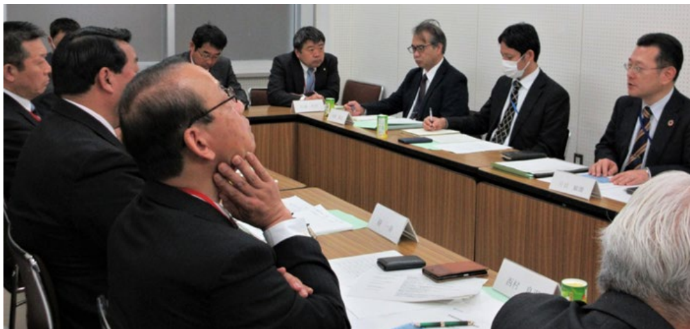
農林水産省との意見交換会