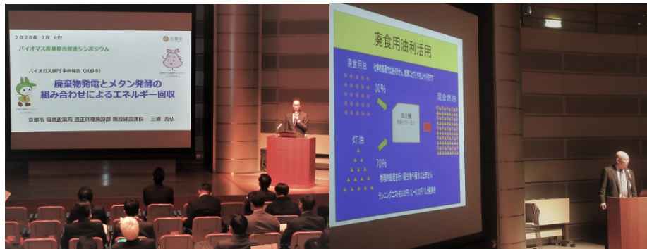
事例報告2 京都市 三浦氏