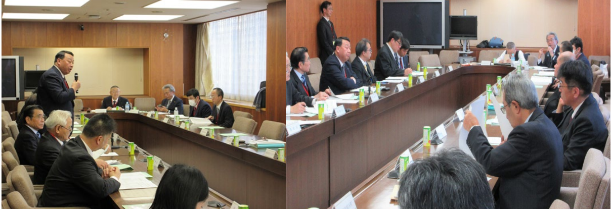
2019 年度 バイオマス産業都市推進協議会に関する情報交換