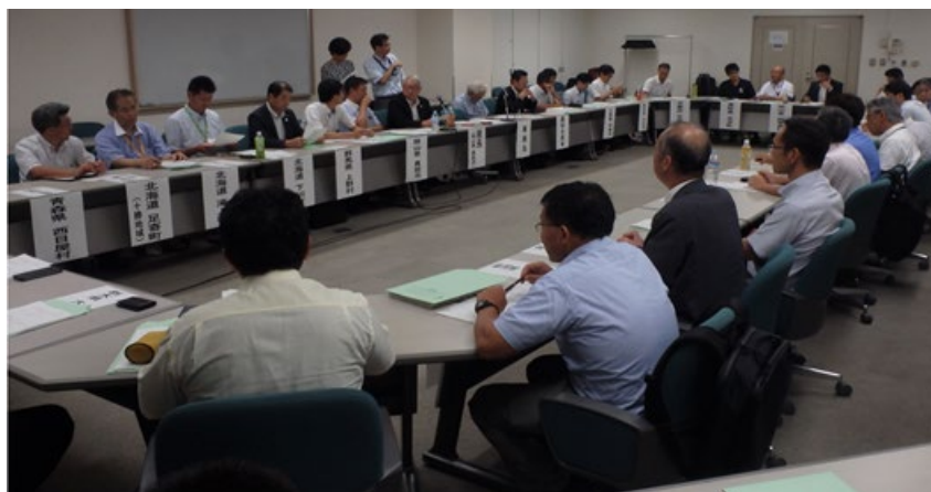
木質バイオマス分科会（タワーホール船堀 401 会議室）