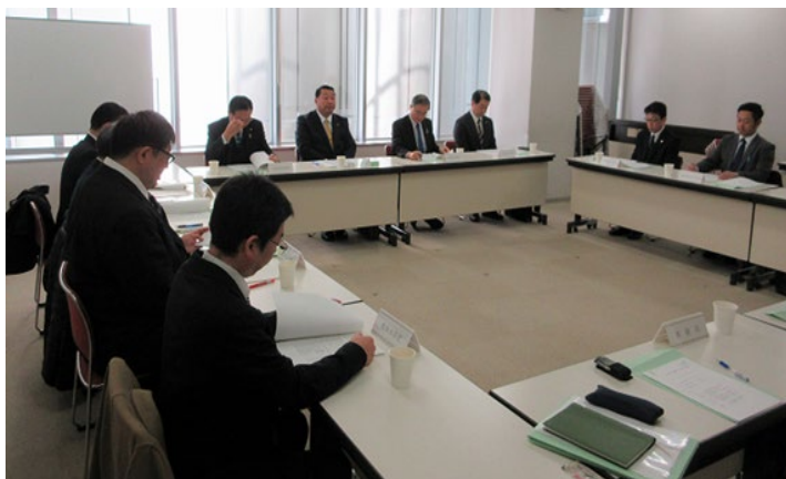
第 3 回 理事会（東京ウィメンズプラザ第 1 会議室）