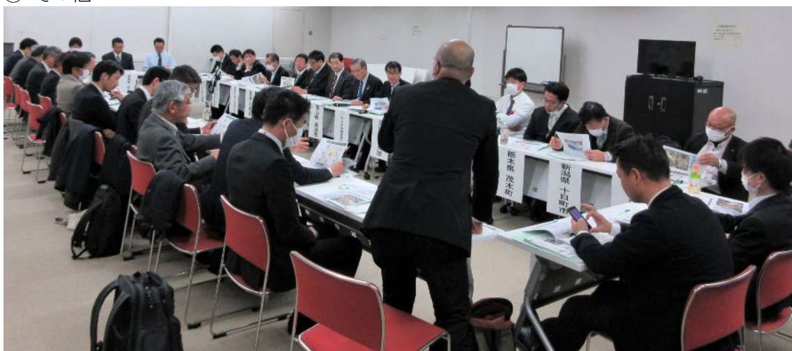
木質バイオマス分科会（東京ウィメンズプラザ 視聴覚室）