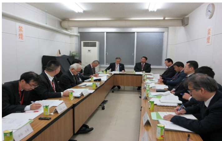
第 2 回理事会（農林水産省会議室）