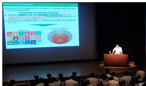
環境省からの情報提供