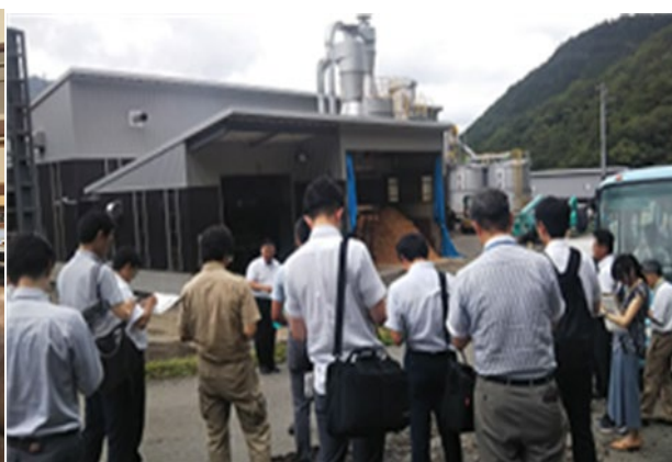
木質ペレット工場の視察