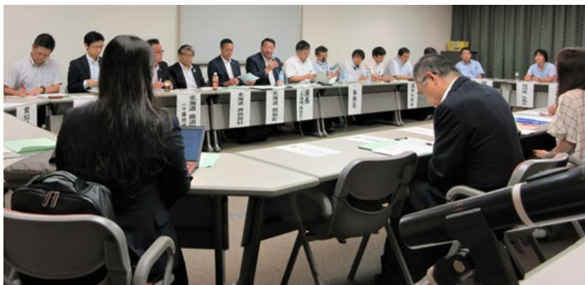
バイオガス分科会（タワーホール船堀303会議室）