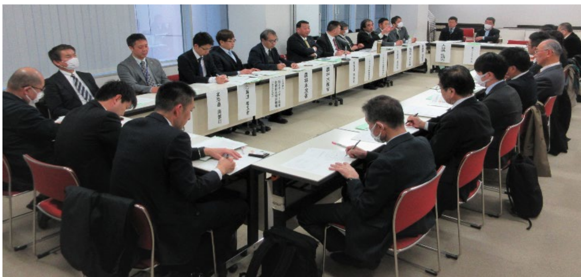
バイオガス分科会（東京ウィメンズプラザ 第1会議室）