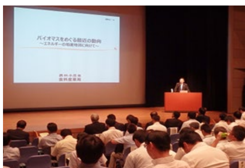
農林水産省からの情報提供