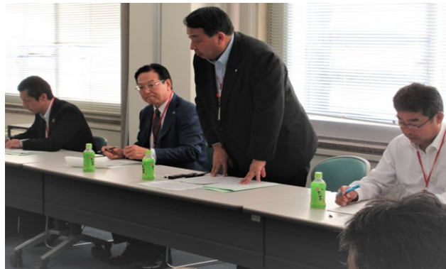
第1回理事会（農林水産省会議室）