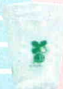
バイオマス プラカップ