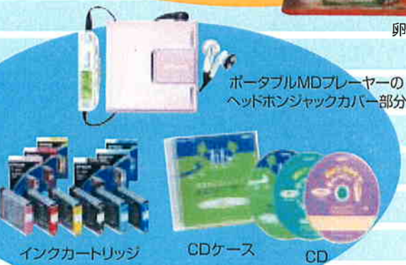
インクカートリッジ