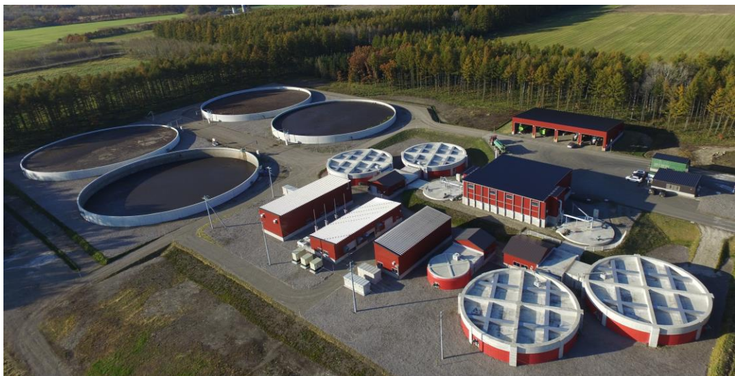
瓜幕バイオガスプラント