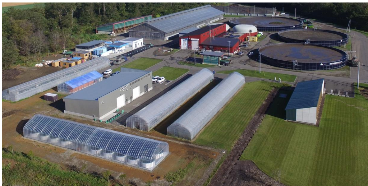
中鹿追バイオガスプラント 全景