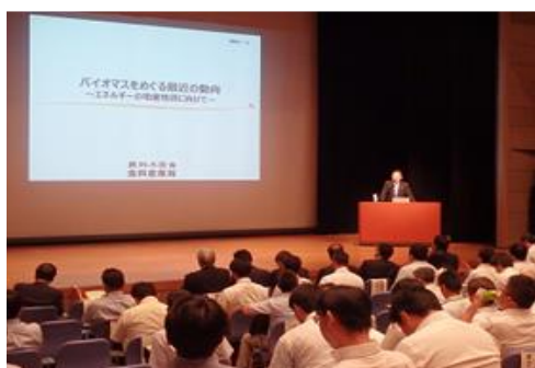
農林水産省からの情報提供