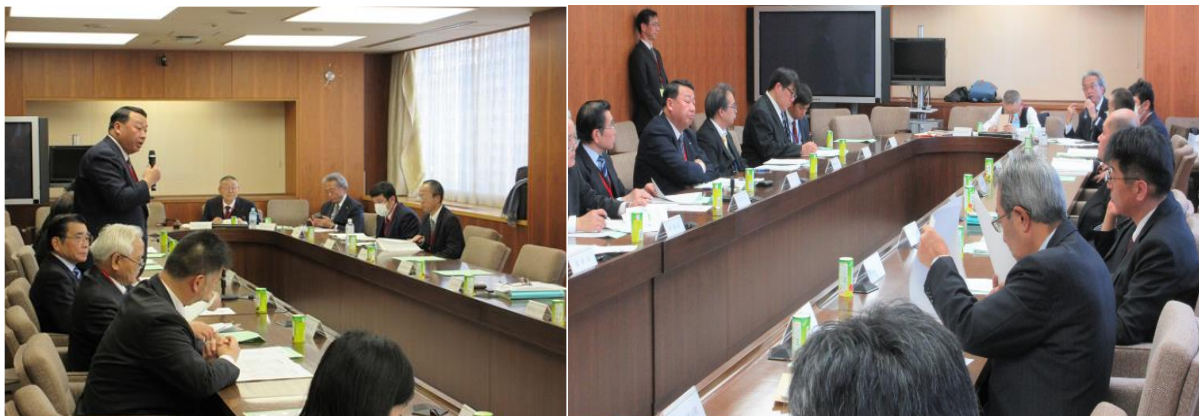
2019年度 バイオマス産業都市推進協議会に関する情報交換