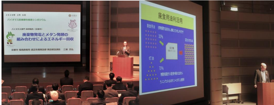
事例報告2 京都市 三浦氏 事例報告3 射水市 竹内氏