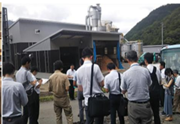
木質ペレット工場の視察