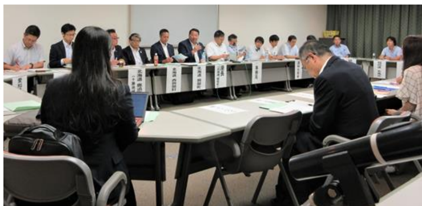
バイオガス分科会（タワーホール船堀303会議室）