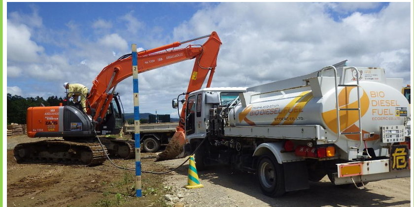
写真：工事現場で重機への給油の様子 B5供給は(株)エコERCが行っている。