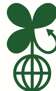
バイオマスマーク

申請書類 https://www.jora.jp/biomassmark/application_documents/