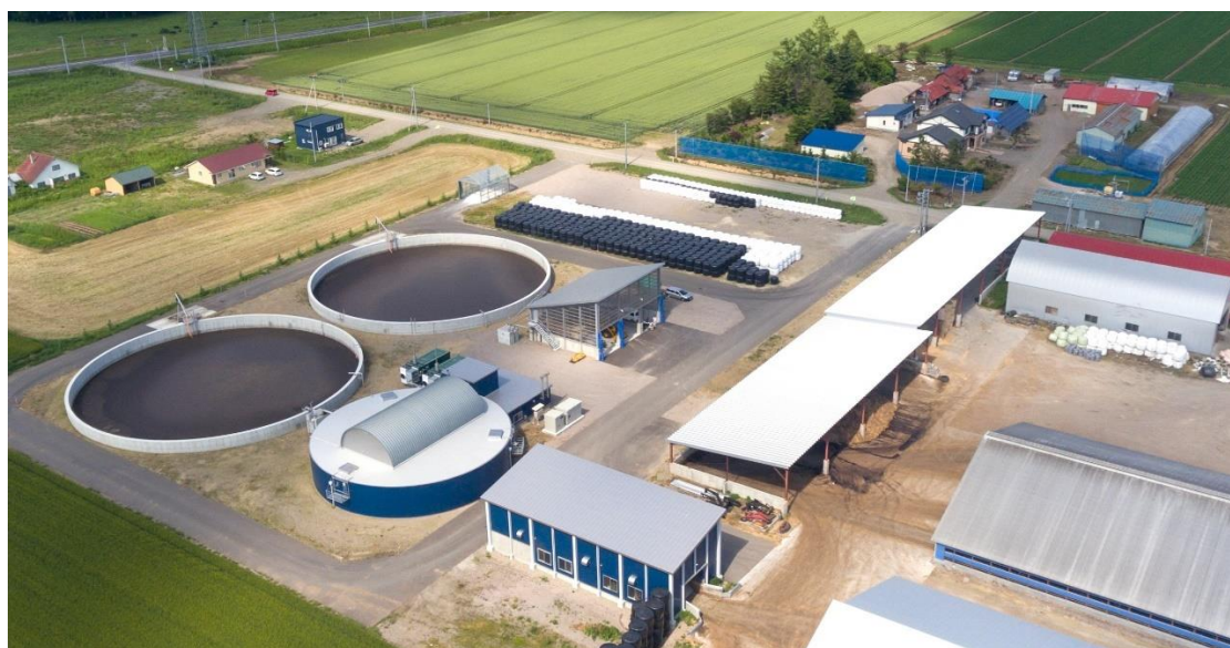
バイオガスプラント 全景